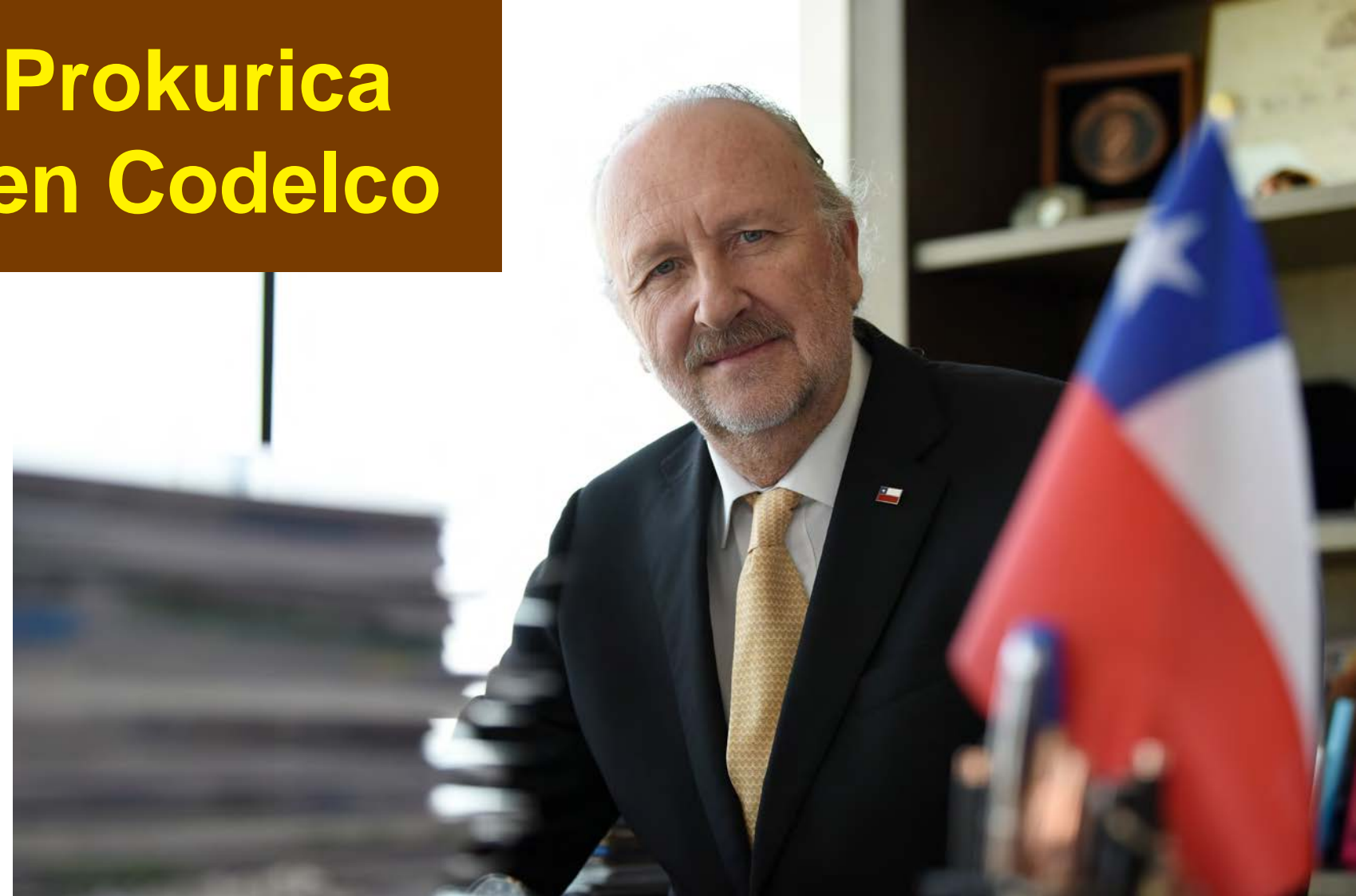
Ministro de Minería de Chile Aldo Prokurica