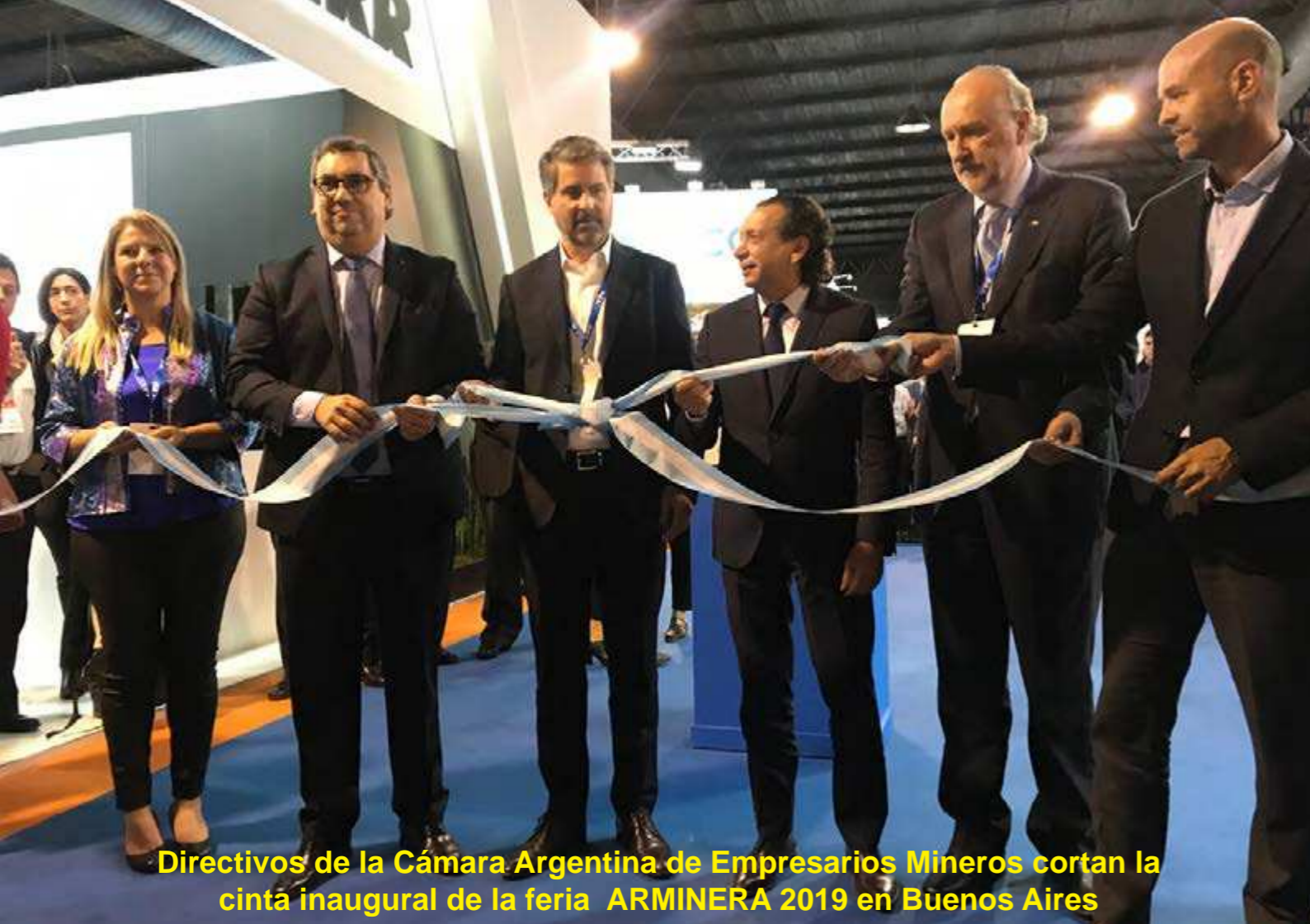
Directivos de la Cámara Argentina de Empresarios Mineros cortan la cinta inaugural de la feria ARMINERA 2019 en Buenos Aires