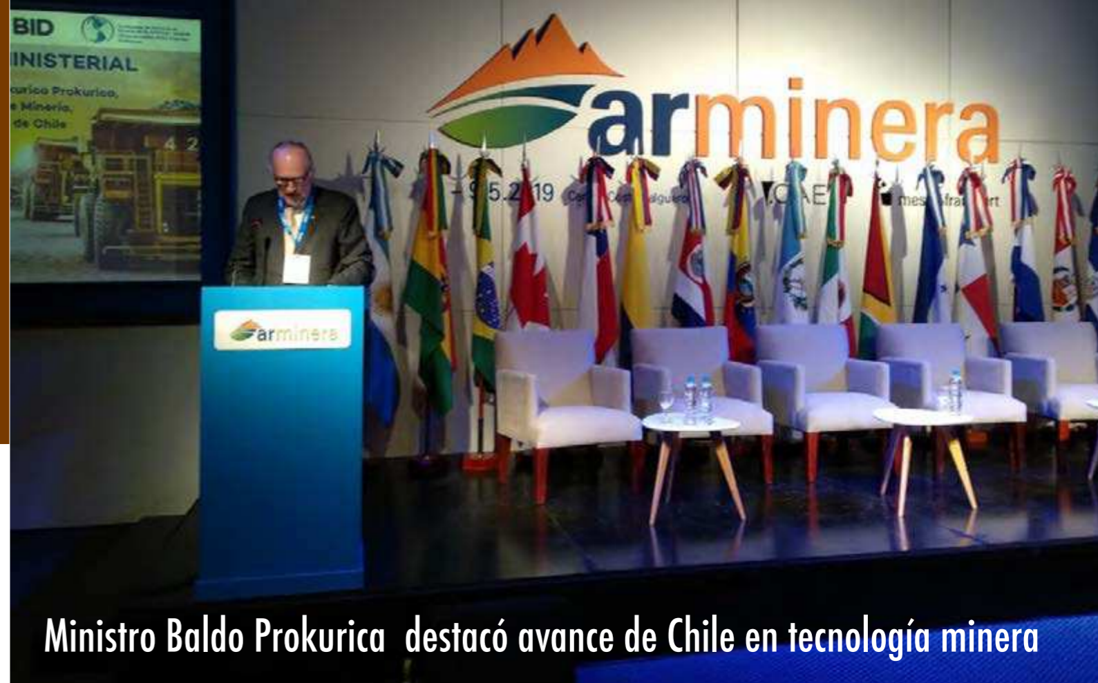
Ministro Baldo Prokurica destacó avance de Chile en tecnología minera

La Cámara Argentina de Empresarios Mineros (CAEM) nuclea a toda la actividad minera. Representa, en todas sus etapas productivas, a empresas que se dedican a la minería metalífera, no metalífera y a materiales para la construcción. También se encuentran presentes Cámaras de exploración, las Cámaras provinciales de la industria y proveedores: desde fabricantes de maquinaria, hasta empresas de insumos y servicios; asesores técnicos; legales; y financieros.