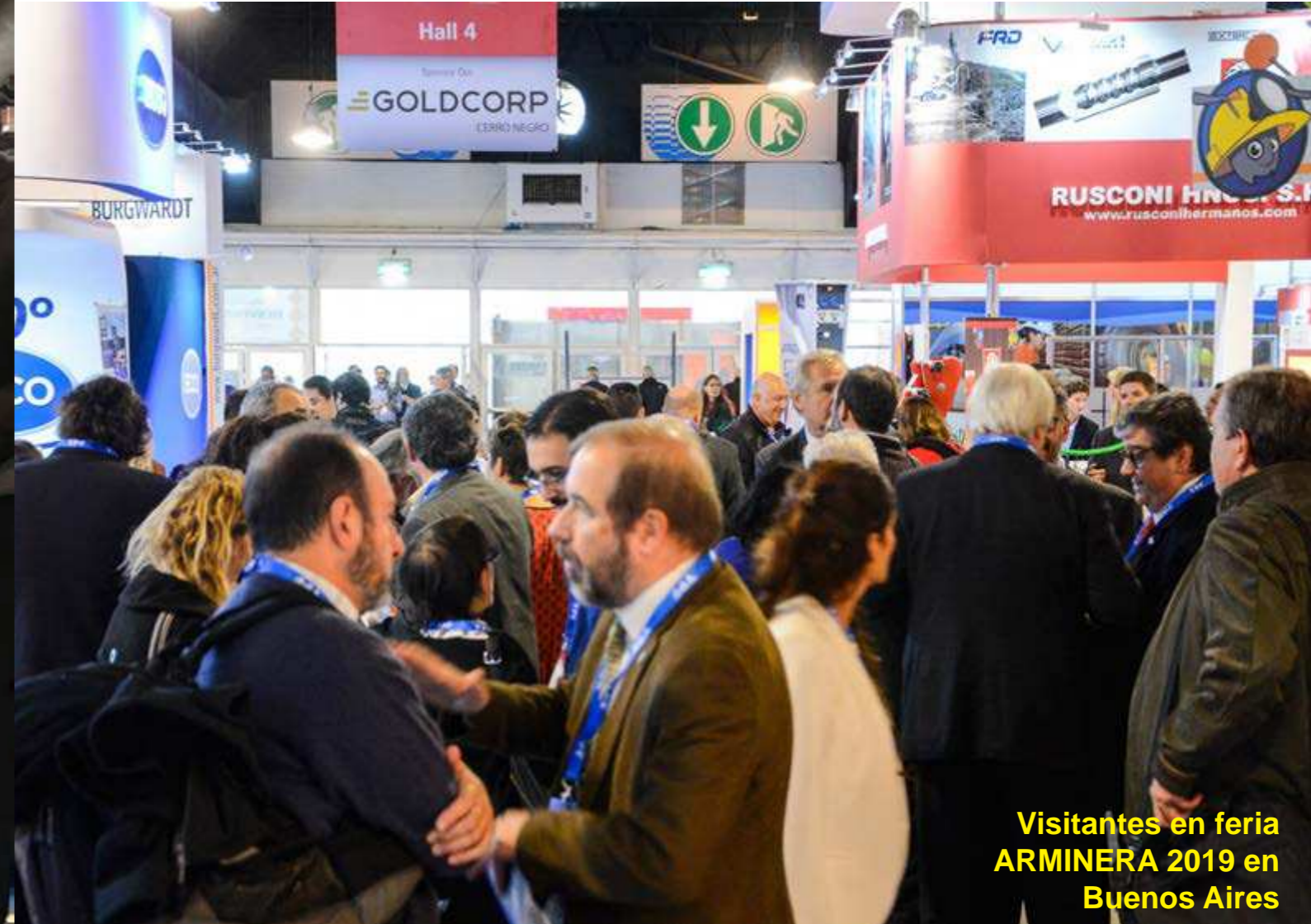
Visitantes en feria ARMINERA 2019 en Buenos Aires