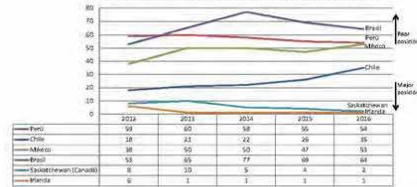
Evolución del índice de percepción de políticas, últimos 5 años

Finalmente, en índice de atractivo a la inversión el Perú se ubica en la posición 28 (segundo quintil), escalando ocho posiciones respecto del 2015. El potencial minero parece explicar el avance, dada la casi nula variación observada en el índice de percepción de políticas. Con ello, lideramos el ranking de atractivo a nivel latinoamericano, superando a Chile por primera vez, lo cual, vale señalar, se explica sobre todo por la percepción de pérdida de potencial geológico del vecino país. Asimismo, hemos mejorado sustancialmente frente a los otros países de la región, pero aún estamos lejos de jurisdicciones de Canadá y Australia, que figuran como líderes a nivel mundial.