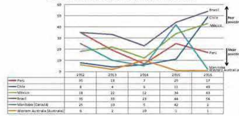
Evolución del índice de potencial minero, últimos 5 años

El índice de percepción de políticas muestra al Perú en el tercer quintil de la muestra de países (puesto 54), muy por debajo de nuestros principales competidores (Canadá, Estados Unidos, Australia, Chile, entre otros) y reflejando una evolución en la posición sin mayores cambios.