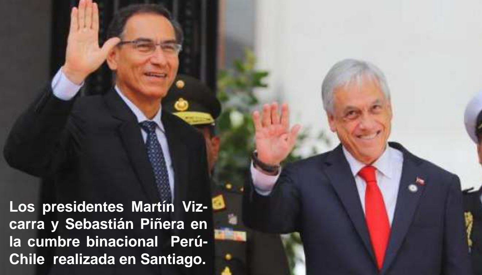
Los presidentes Martín Vizcarra y Sebastián Piñera en la cumbre binacional Perú-Chile realizada en Santiago.