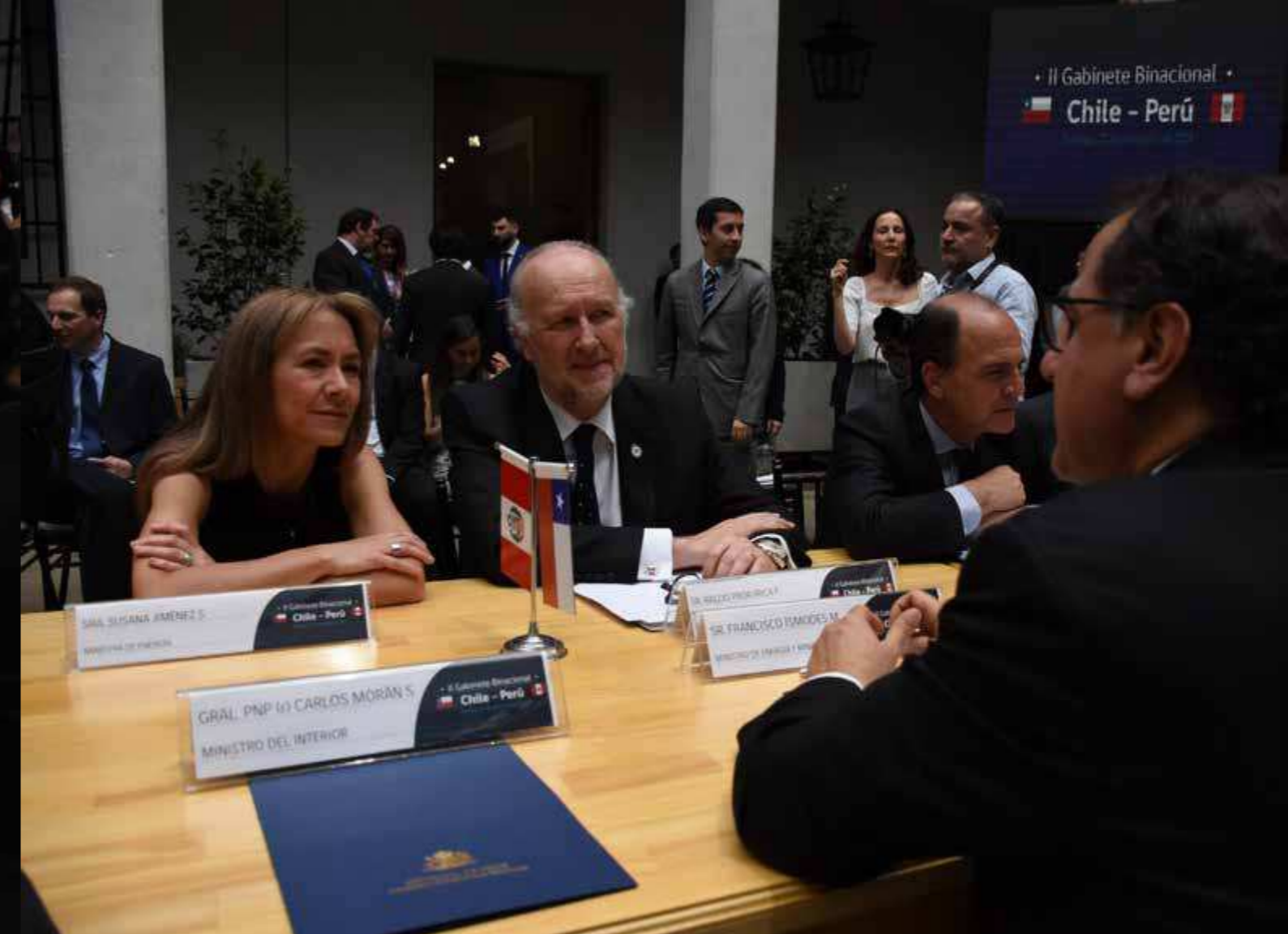
El ministro de Minería de Chile, Baldo Prokurica en ameno diálogo con el ministro de Energía y Minas del Perú, Francisco Ísmodes En la otra foto con la Ministra de Energía

“Perú es un socio estratégico, ambos países en conjunto representan enormes riquezas mineras, y esa alianza potencia la industria y el continente”, enfatizó Prokurica.