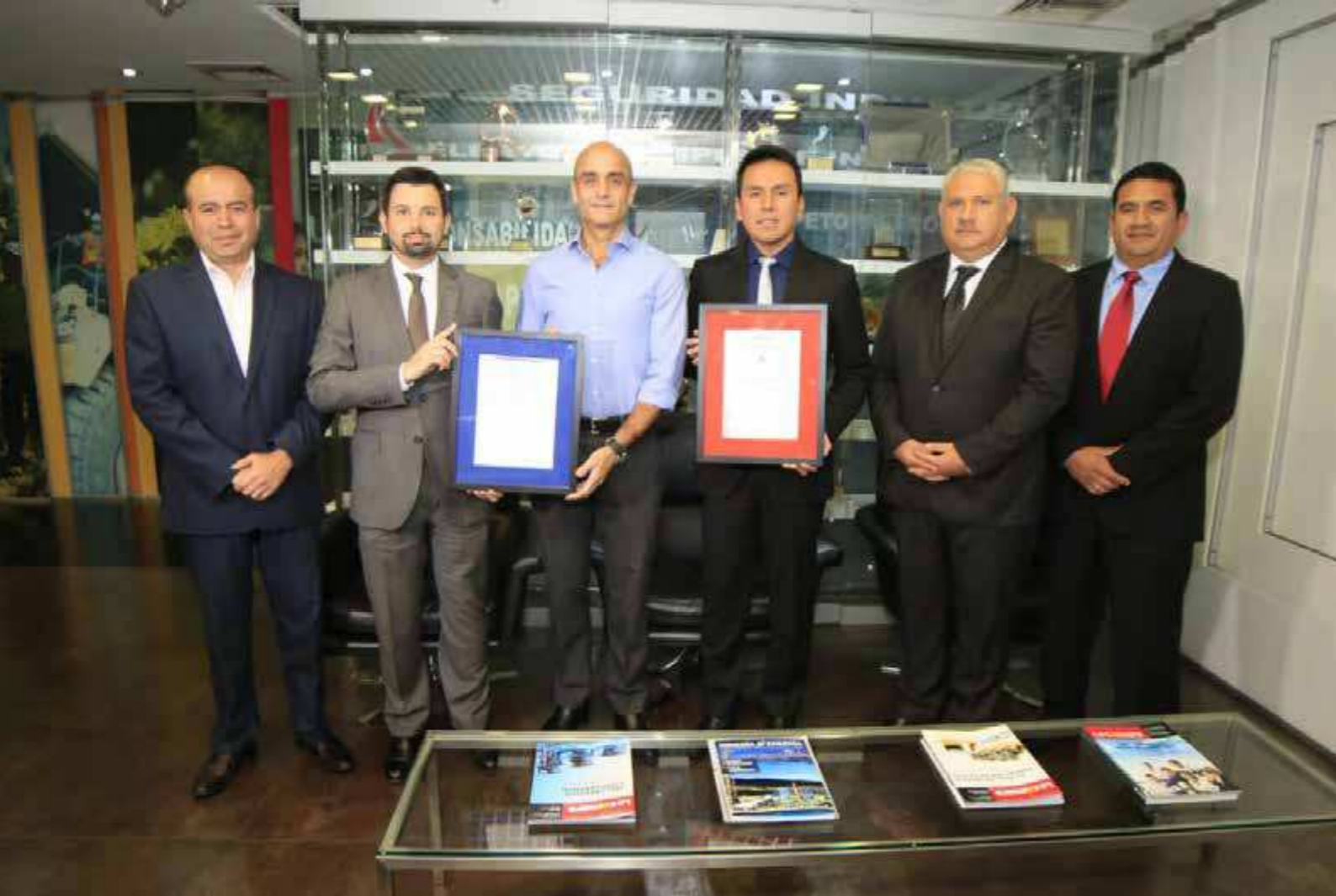
Ejecutivos de la Compañía Minera Antamina, muestran la certificación ISO 27001 de la certificadora AENOR de España

La certificación del Sistema de Gestión de Seguridad de la Información, de acuerdo a UNE-ISO/IEC 27001, contribuye a fomentar las actividades de protección de la información en las organizaciones.