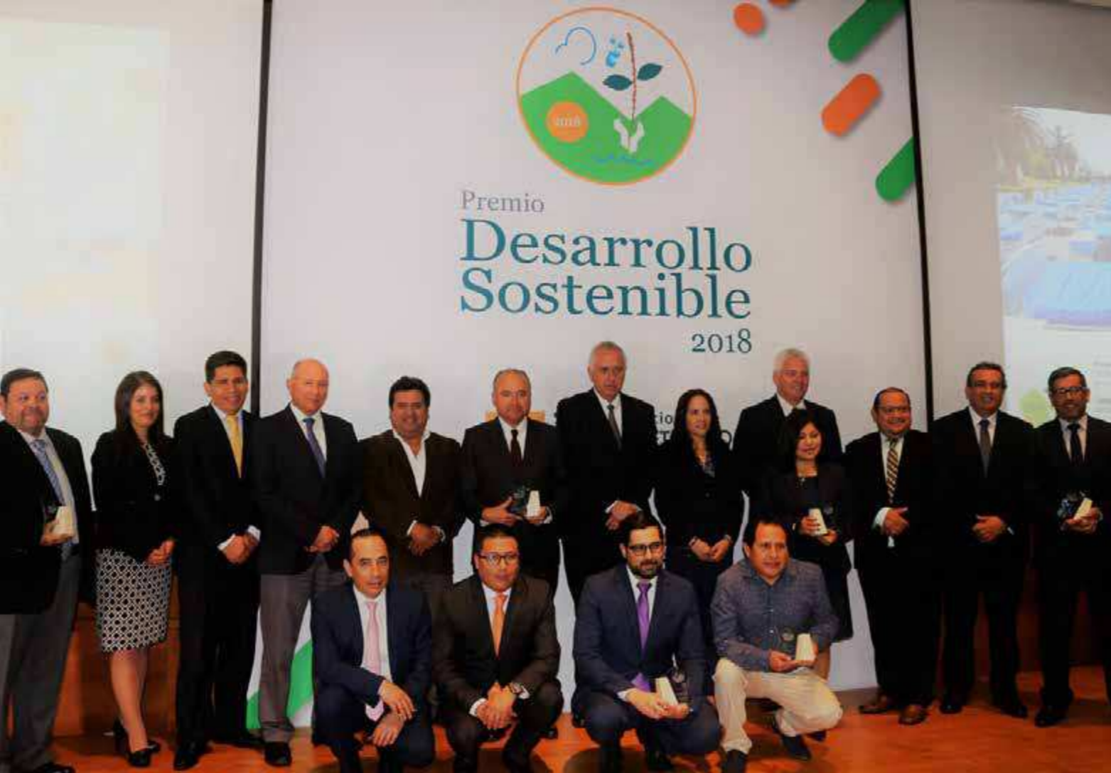
En la foto los representantes de las empresas ganadoras del Premio Desarrollo Sostenible 2018 organizado por la SNMPE.