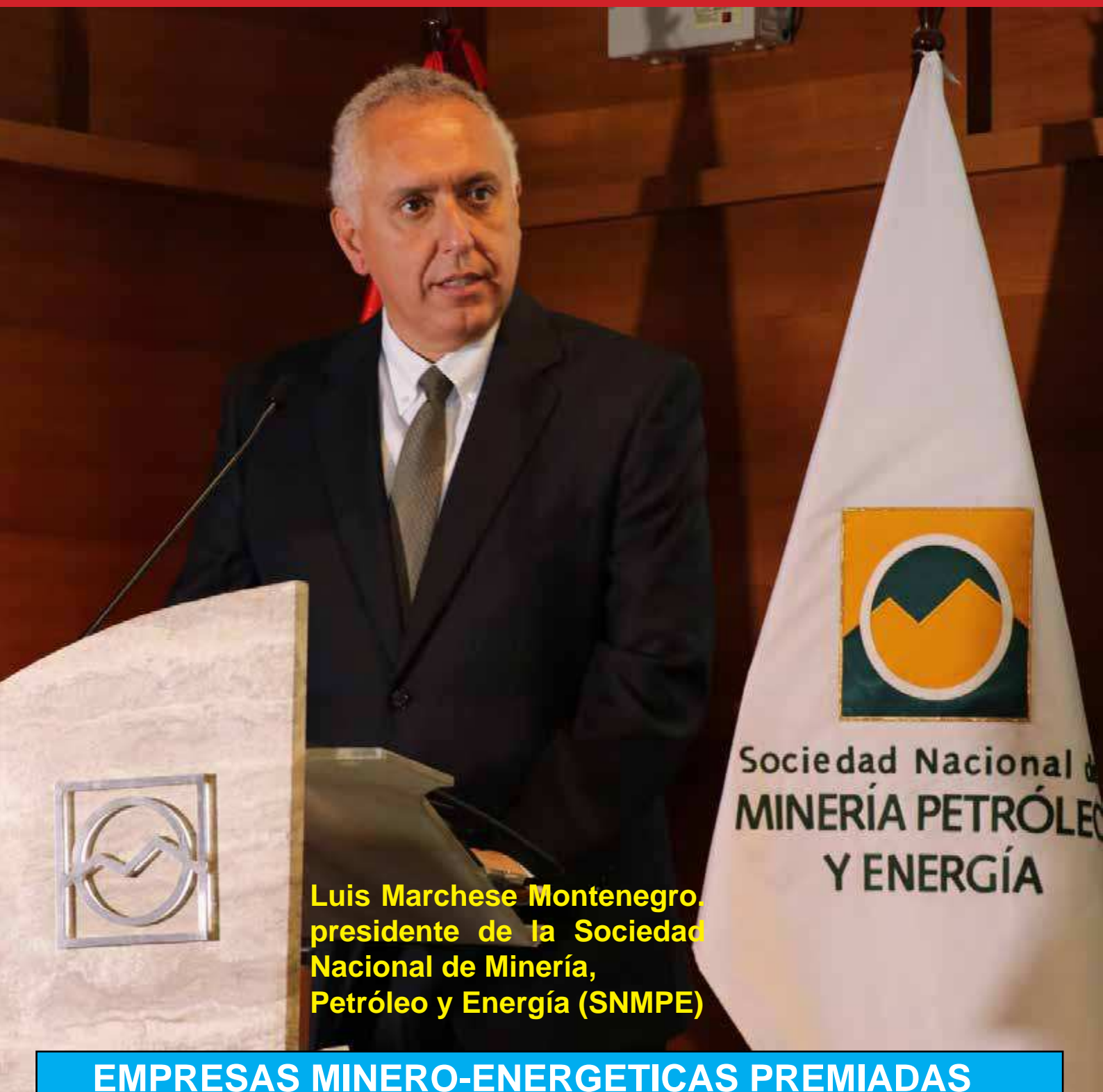
Luis Marchese Montenegro, presidente de la Sociedad Nacional de Minería, Petróleo y Energía (SNMPE)