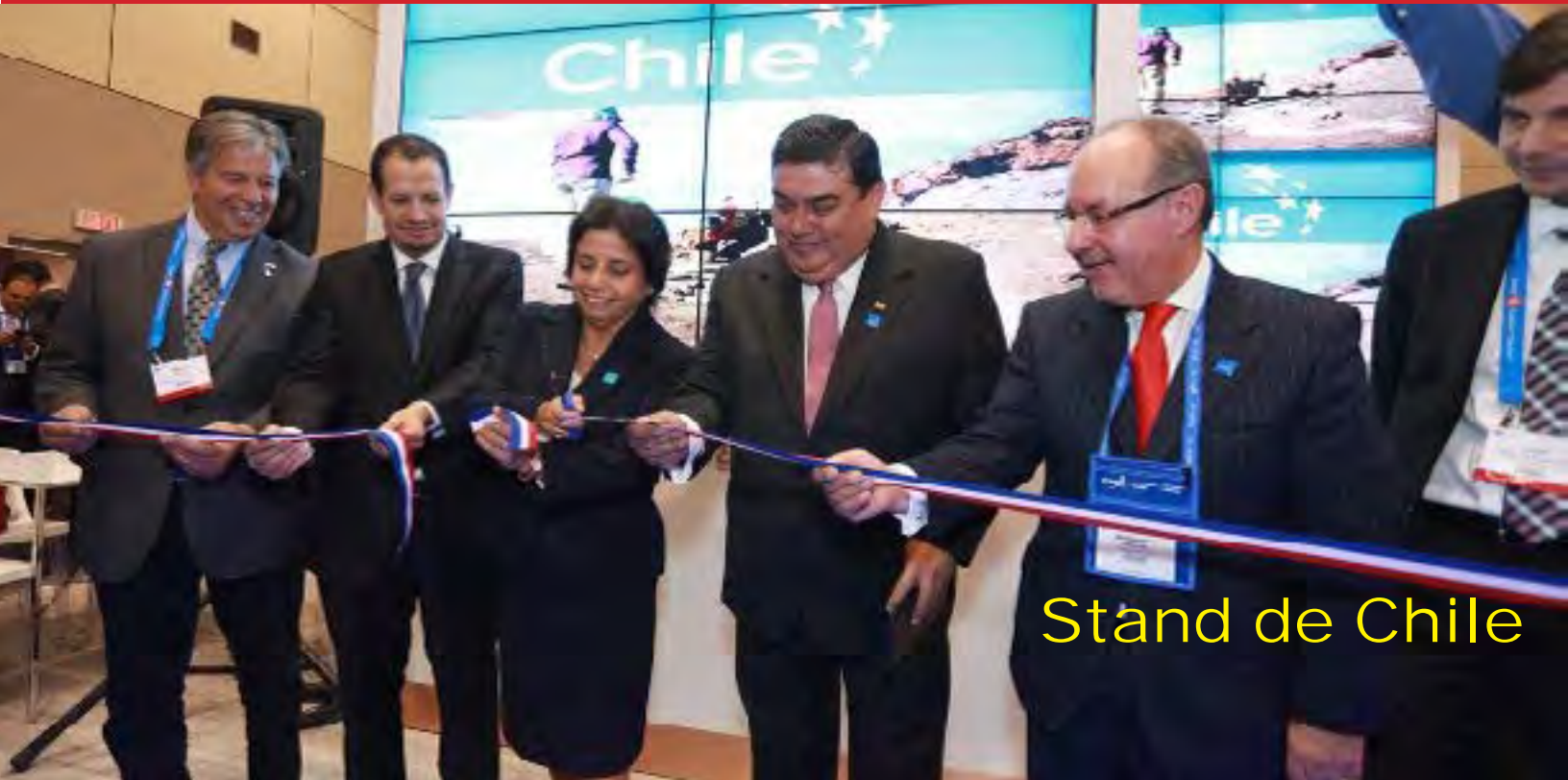
Stand de Chile