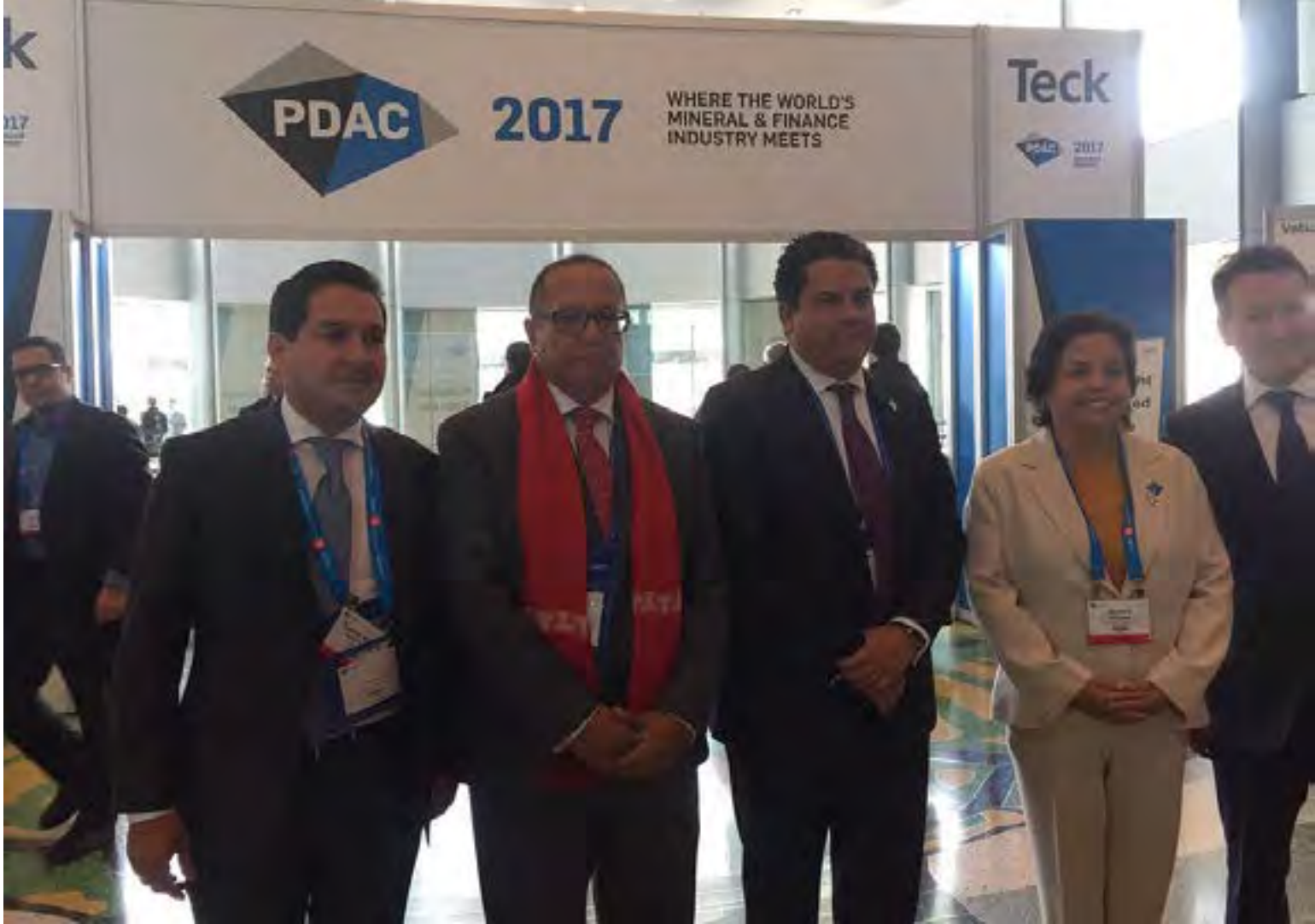
La ministra de Minería, Aurora Williams, con los ministros de minería de los países de la Alianza del Pacífico durante el encuentro en PDAC 2017.

de la Presidenta Michelle Bachelet de convertir a la minería en una plataforma de desarrollo integral”, lo que ha llevado al Ejecutivo a “impulsar e intensificar” un trabajo conjunto con el sector privado y representantes sociales y académicos para alcanzar esa meta, aseguró.