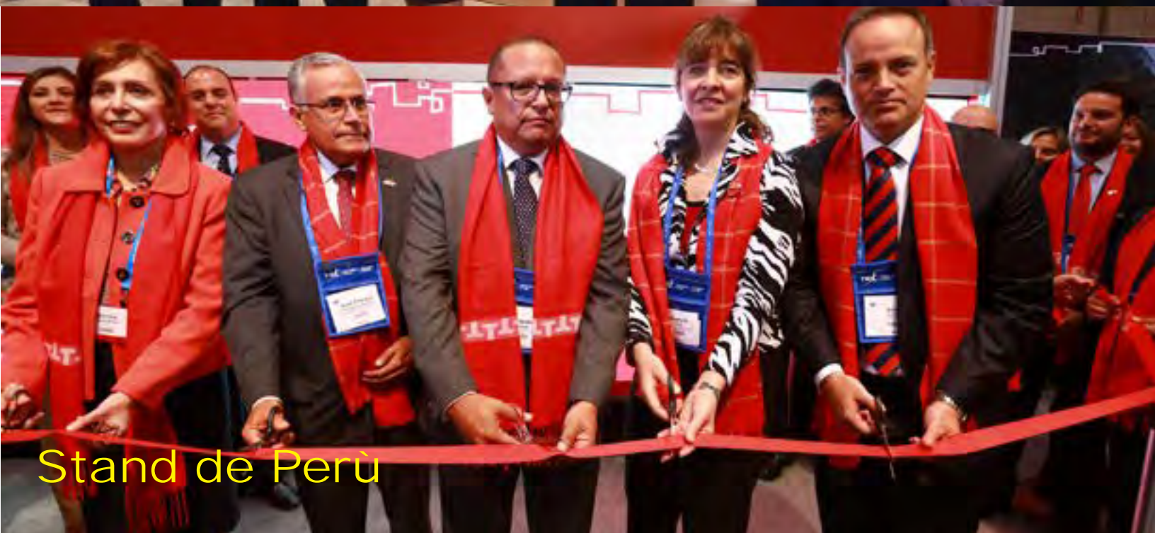
Stand de Perú