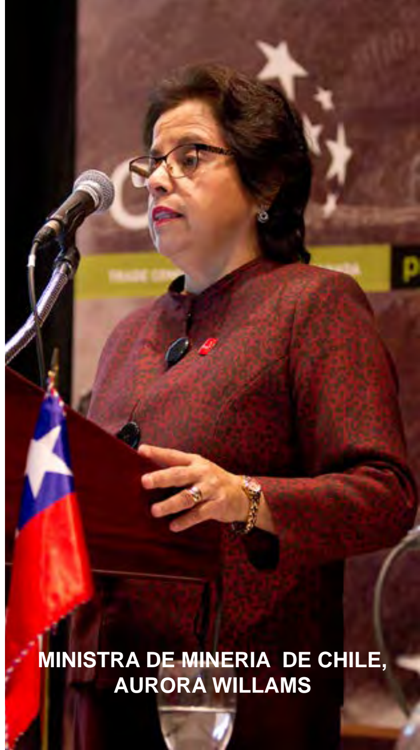
MINISTRA DE MINERIA DE CHILE, AURORA WILLAMS

La ministra destacó que según el Catastro Nacional de Concesiones Mineras, elaborado por el Servicio Nacional de Geología y Minería, Sernageomin, “el 61% del territorio con potencial geológico está disponible para ser concesionado”. Otro atributo que tiene Chile, según la autoridad, es el Plan Nacional de Geología que entrega mapas de geología básica, geofísico y geoquímico, los que ofrecen