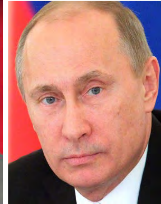
LIDERES MUNDIALES VENDRAN AL PERU: Los presidentes de EE.UU, Barack Obama; de China, Xi Jinping y de Rusia, Vladimir Putin, vendrán a Lima a la cita cumbre de la APEC.