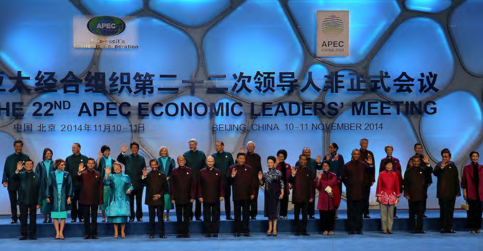
Los presidentes y jefes de gobierno de los países miembros de la APEC durante la la cita cumbre mundial de la APEC, realizada en China, el año 2014.