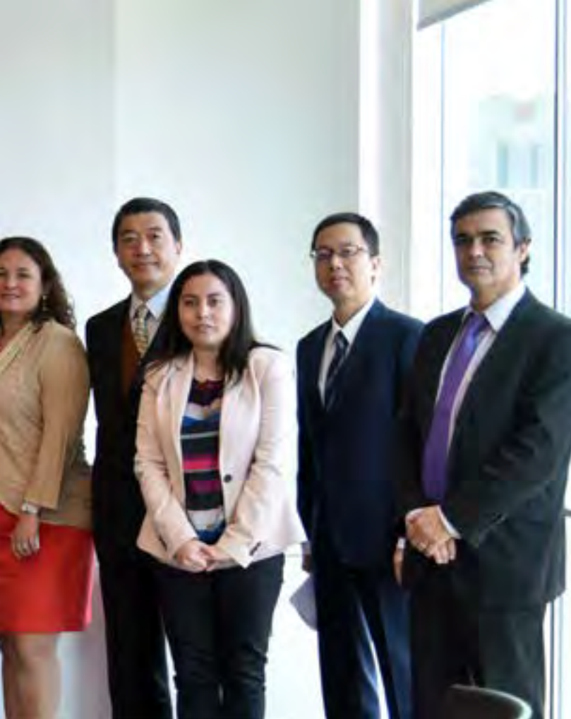
Dos aspectos de la reunión de la ministra Aurora Williams con embajadores de países mineros

próxima feria Exponor y las diversas actividades que se desarrollarán en agosto, mes de la Minería y en otros eventos.