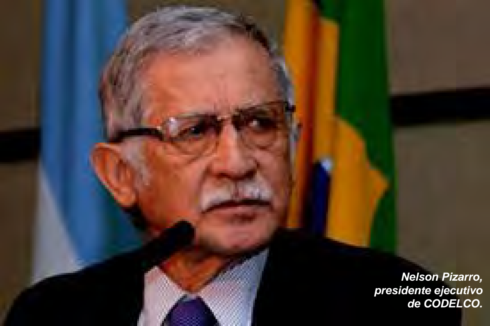
Nelson Pizarro, presidente ejecutivo de CODELCO.

“Estamos contentos porque hicimos bien la pega; hoy somos una mejor empresa, pero los buenos resultados obtenidos en 2016 no modifican el exigente escenario estructural de Codelco”