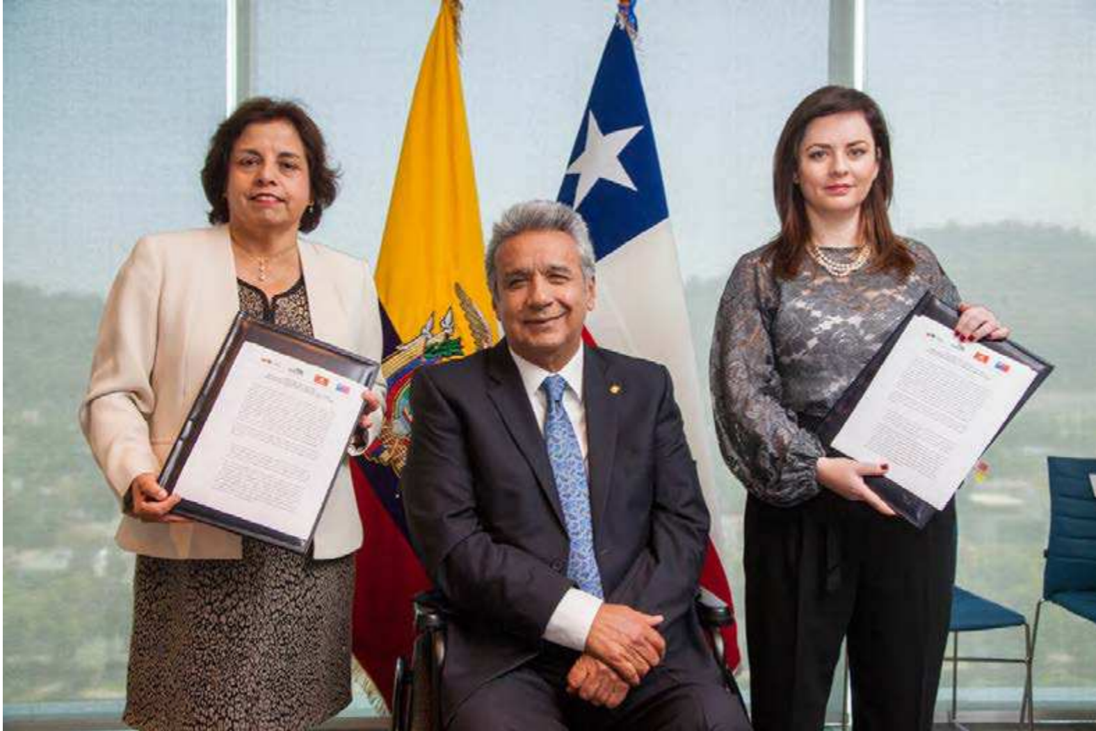
El Presidente de la República de Ecuador, Lenín Moreno, y las ministras de Minería de Chile Aurora Williams y Rebeca Illescas, de Ecuador durante la firma del acuerdo minero binacional