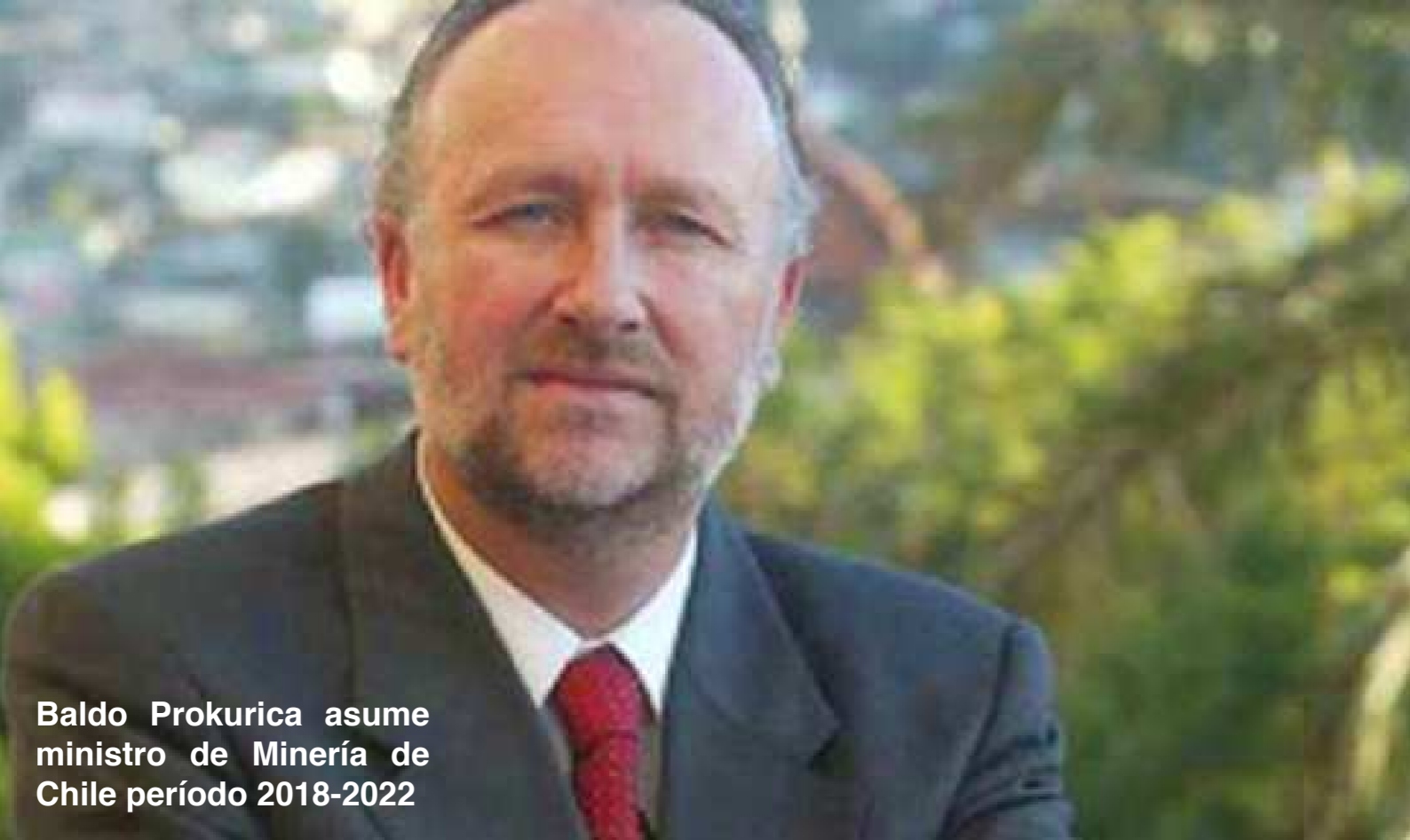
Baldo Prokurica asume ministro de Minería de Chile período 2018-2022