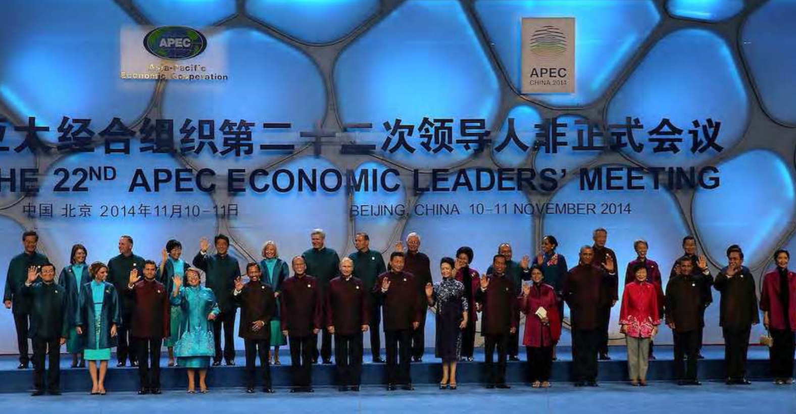
Los presidentes y jefes de gobierno de los países miembros de la APEC durante la la cita cumbre mundial de la APEC, realizada en China, el año 2014.