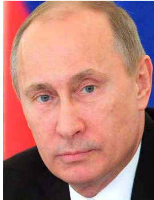
LIDERES MUNDIALES VENDRAN AL PERU: Los presidentes de EE.UU, Barack Obama; de China, Xi Jinping y de Rusia, Vladimir Putin, vendrán a Lima a la cita cumbre de la APEC.